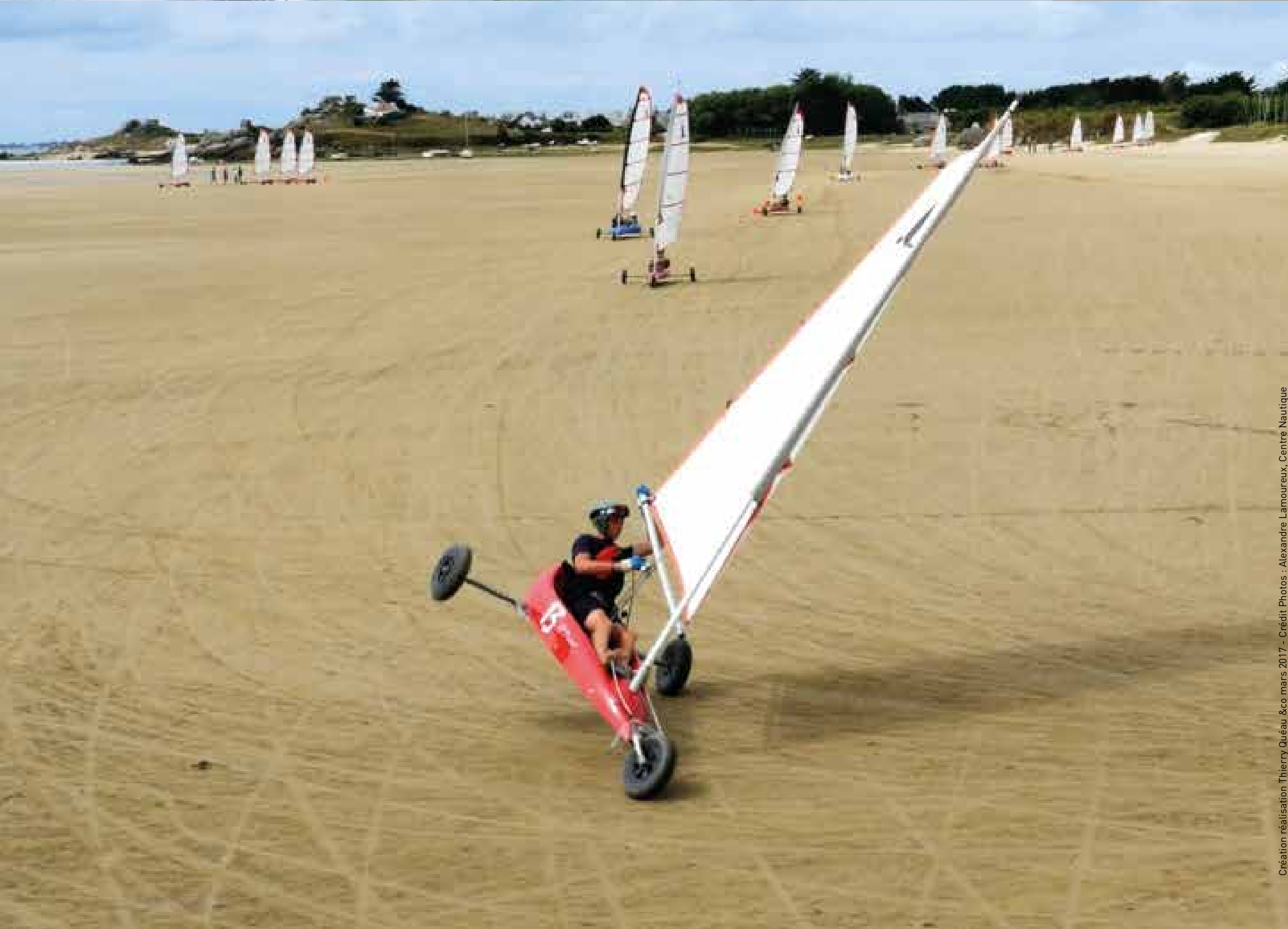
Création réalisation Thierry Quéau & co mars 2017